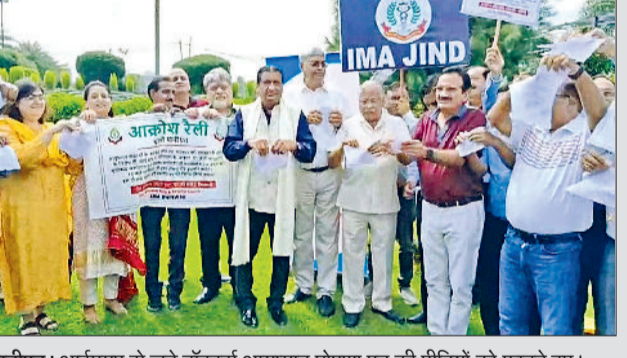
पानीपत। आईएसएम से जुड़े डॉक्टरों आयुष्मान घोषणा पत्र की प्रतियों को फाड़ने हुए।

पानीपत। पानीपत में इंडियन मेडिकल एसोसिएशन द्वारा राष्ट्रीय बैचक का आयोजन किया गया। बैचक में देश भर से आइएसएम से जुड़े डॉक्टरों ने बैचक में भाग लिया। वहीं हरियाणा से अलग-अलग जिलों से आए डॉक्टरों ने आयुष्मान घोषणा पत्र की प्रतियों को जलाकर सरकार के खिलाफ नारे लगाए। वहीं आइएसएम से सरकार को वेतानकी दी की जब तक सही ढंग से कोई योजना नहीं बनेगी तब तक प्रदेश का कोई भी डॉक्टर आयुष्मान सुविधा मरीजों को उपलब्ध नहीं कराएगा।