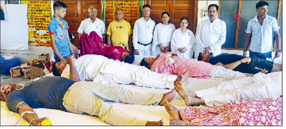
इंद्री। देवी मंदिर इंद्री में लगे रक्तदान शिविर में रक्तदान करते रक्तदाता व उपस्थित आयोजक।

मानवता की सेवा के लिए प्रत्येक स्वस्थ व्यक्ति को रक्तदान करना चाहिए हरिभूमि न्यूज ► इंद्री