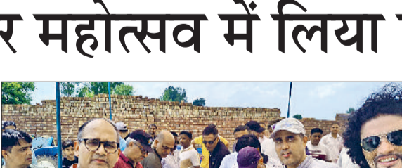
पानीपत। राष्ट्रीय घेवर महोत्सव घेवर का लुप्त लेते विभिन्न संगठनों के पदाधिकारीगण।

पानीपत के गांव चमराड़ा स्थित रण राज प्राकृतिक खेती फार्म पर राष्ट्रीय घेवर महोत्सव सीजन श्री मनाया गया। वहीं, घेवर महोत्सव में 60 से अधिक विभिन्न सामाजिक और घुमक्कड़ संगठनों के सदस्यों ने भाग लिया। स्मरणीय है कि वर्षा ऋतु में घेवर का विशेष महत्व है। इसलिए वर्षा ऋतु में आयोजित होने वाले इस आयोजन का नाम घेवर महोत्सव रखा गया है। वहीं घेवर शुद्ध देशी घी से बनाया जाता है। घेवर महोत्सव में घुमक्कड़ों दिल से, देशी घुमक्कड़, यायावरी, आरोग्य भारती, अखिल भारतीय राष्ट्रीय शैक्षिक महासंघ, इंडियन