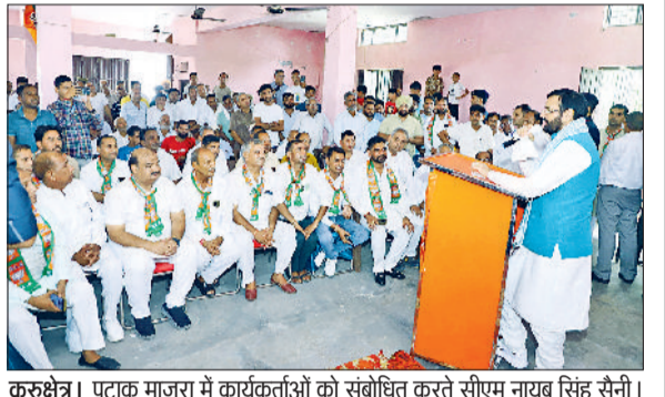
कुरुक्षेत्र। पटाक माजरा में कार्यकर्ताओं को संबोधित करते सीएम नायब सिंह सैनी।

■ गांव पटाक माजरा में विकास के लिए की 21 लाख रुपये देने की घोषणा की