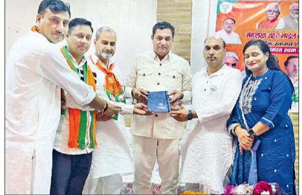
पानीपत। भाजपा की बैठक में वरिष्ठ नेताओं का स्वागत करते हुए मेजबान।