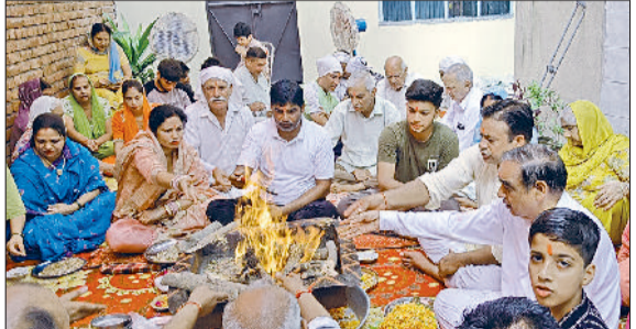
इंद्री। शहर में सुख शांति के लिए हवन यज्ञ करते करवा वासी।