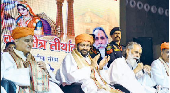
कुरुक्षेत्र। कृष्ण-कश्यप कुरुक्षेत्र तीर्थटन में उपस्थित सीएम नायब सिंह सैनी।

■ झांकी यात्रा में दिखा अस्थात्मिक एवं सांस्कृतिक संगम ■ कश्मीर हिंदुओं की संस्कृति को संवर्धित करने के लिए प्रतिबद्ध हरिभूमि न्यूज़ ►► कुरुक्षेत्र