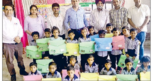
राजकीय स्कूल, रानी महल के विद्यार्थियों के साथ अतिथिगण।